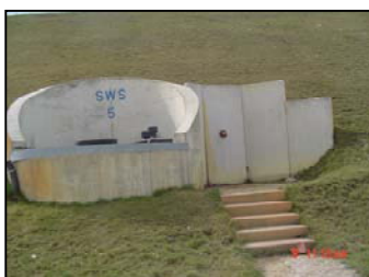
Beispiel eines Mundloches im Außenbereich

Hydrostatik: BFM – Baugrundinstitut Franke-Meißner Berlin-Brandenburg GmbH Vermessung der Messrohre mit dem hydrostatischen Messsystem GLÖTZL