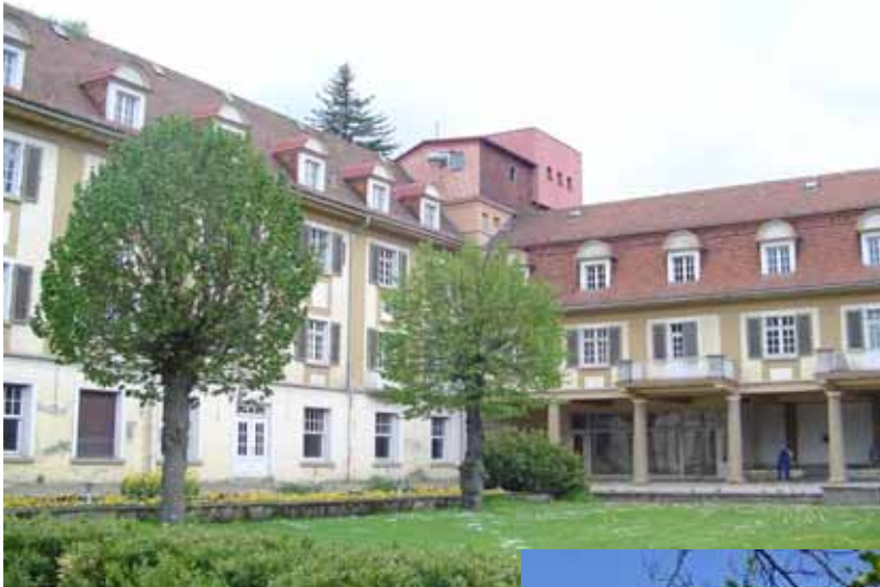
VOR SANIERUNG 2005