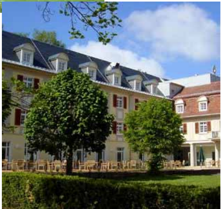
NACH SANIERUNG 2007